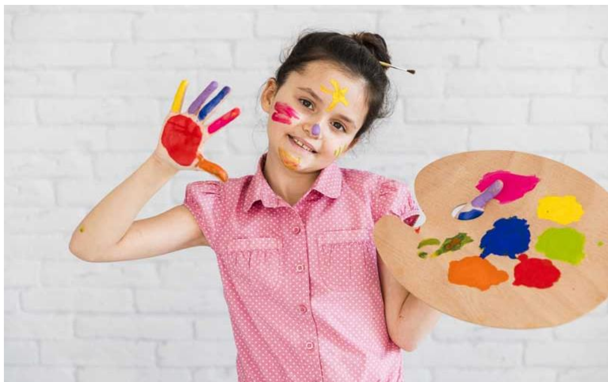
ملزومات مورد نیاز برای شروع نقاشی چیست؟

پالت نقاشی در اندازه و شکل‌های متفاوت موجود است. پالت نقاشی تخته نازکی است که معمولاً از چوب ساخته شده است. البته نوع پلاستیکی آن توسط نقاشان مبتدی مورد استفاده قرار می‌گیرد. هنرمند رنگ‌ها را روی پالت مخلوط می‌کند، پالت طوری ساخته شده تا نقاش بتواند آن را در دست نگه دارد.